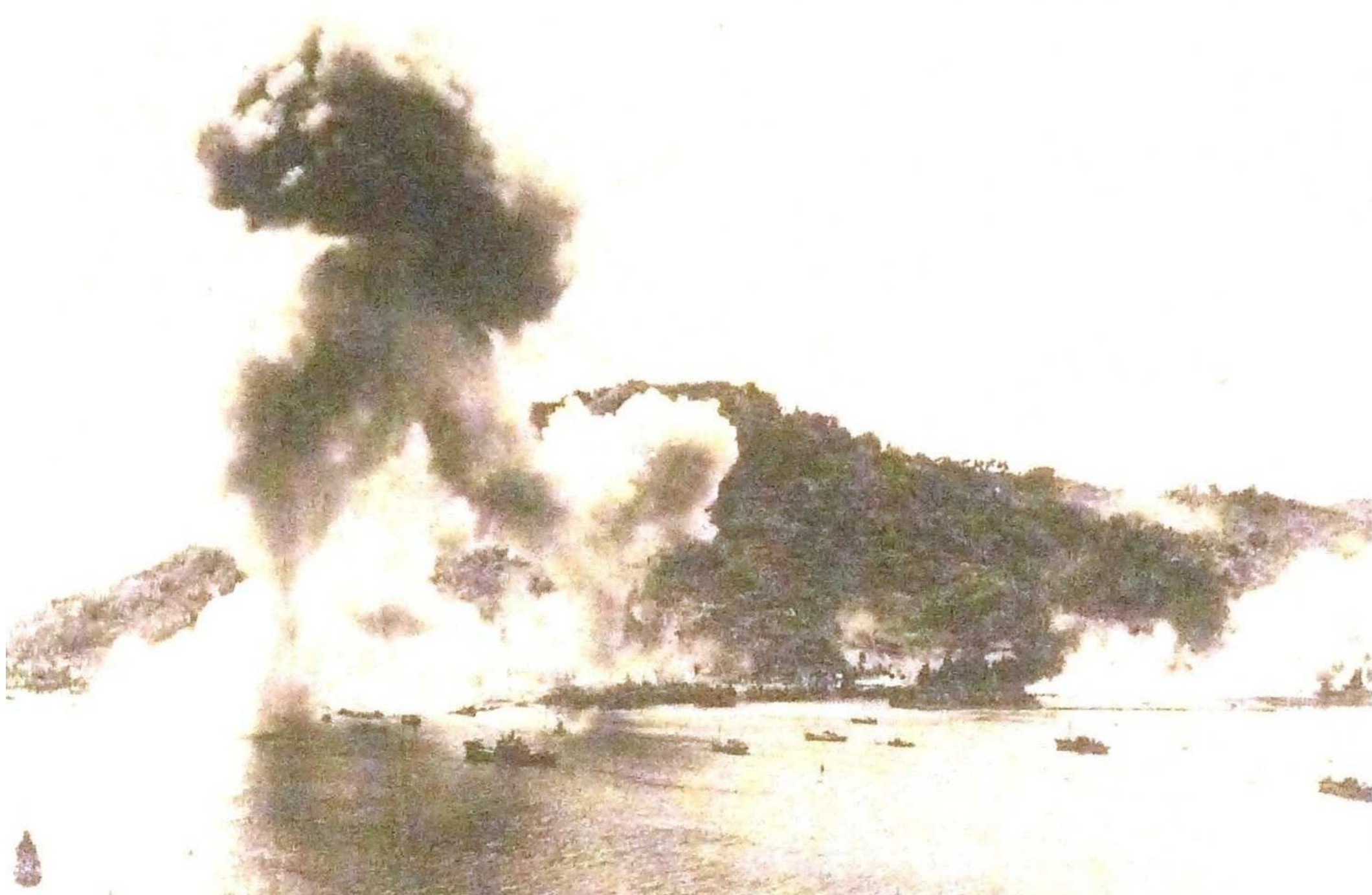
1944(昭和19)年2月17日トラック島は米機動部隊の猛撃を受けた