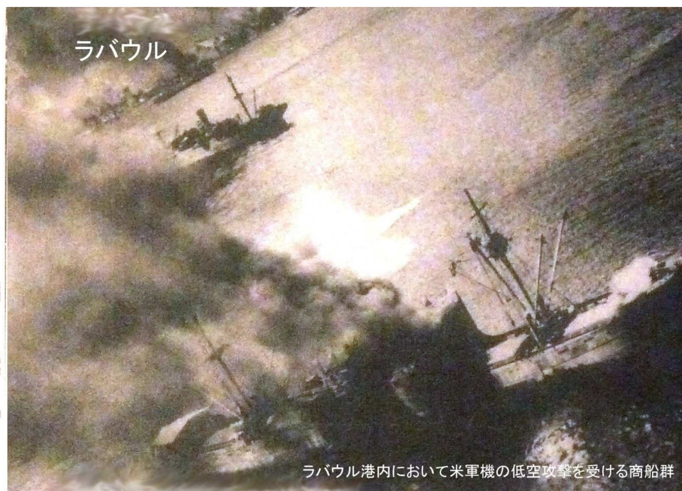
ラバウル港内において米軍機の低空攻撃を受ける商船群